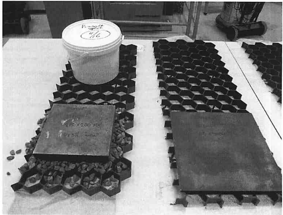
Foto 1. Monsters ter beproeving.